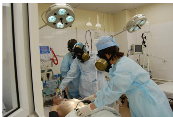
Командно-штабные учения. Палата реанимации и интенсивной терапии поликлиники объекта УХО МСЧ № 41 ФМБА России п. Кизнер

Уничтожение химического оружия имеет огромное международное значение и в то же время отвечает интересам национальной безопасности самой России. Только уничтожение отравляющих веществ может гарантировать полную безопасность населения и природы. Конституция Российской Федерации гарантирует гражданам страны право на благоприятную окружающую среду, достоверную информацию о ее состоянии и на возмещение ущерба, причиненного их здоровью или имуществу экологическим правонарушением.