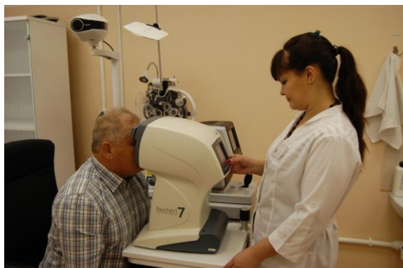
На приеме в офтальмологическом кабинете

Оборудована палата интенсивной терапии на две койки с необходимым набором аппаратуры, где могут быть оставлены под наблюдение пациенты с подозрением на контакт с ОВ.