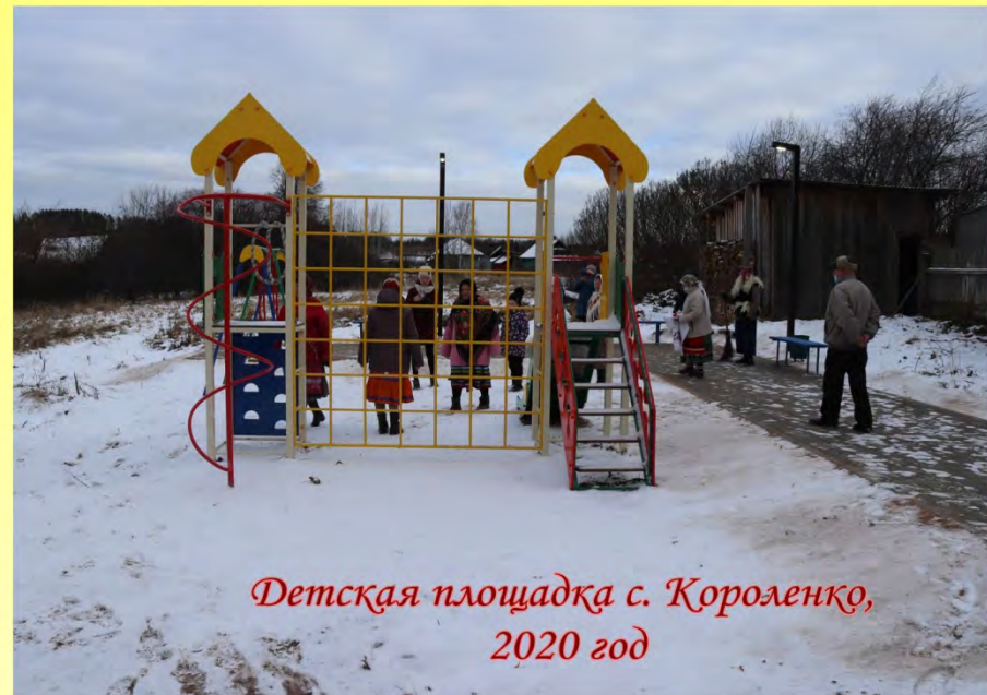
Детская площадка с. Короленко, 2020 год