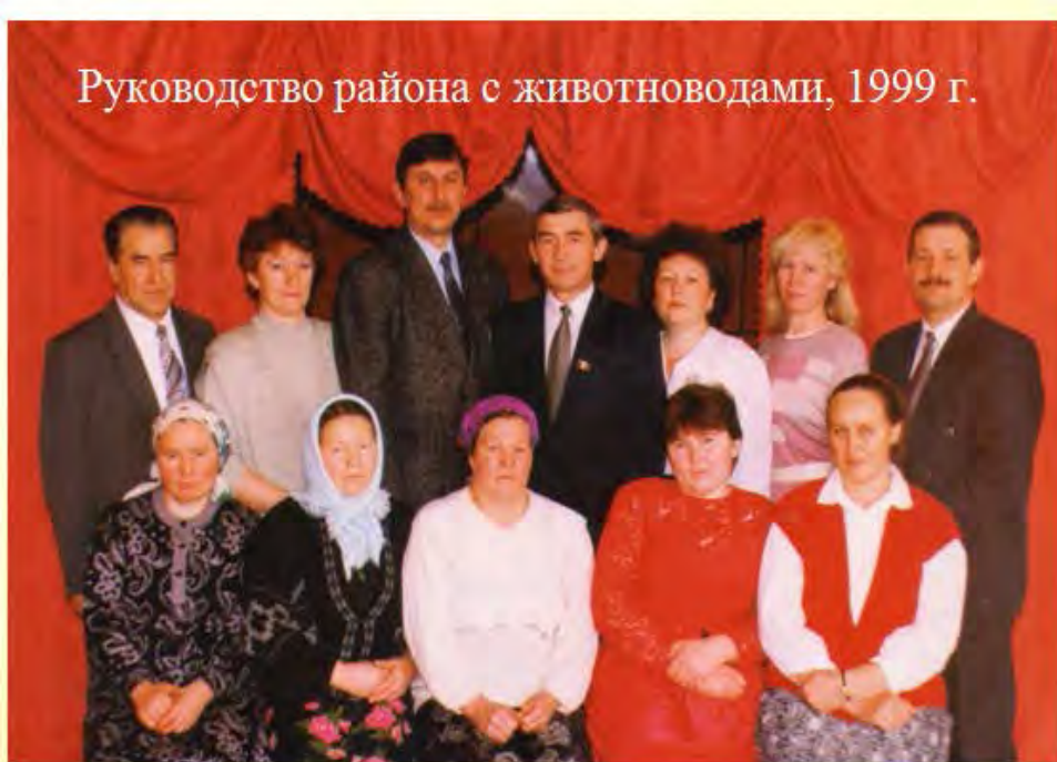
Руководство района с животноводами, 1999 г.