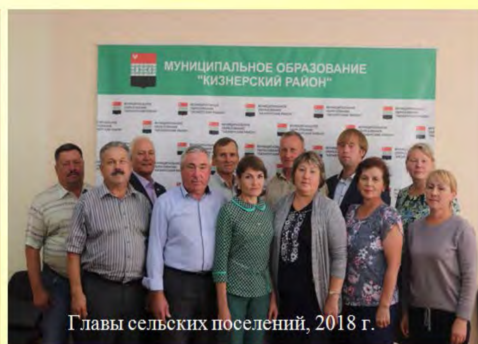
Главы сельских поселений, 2018 г.