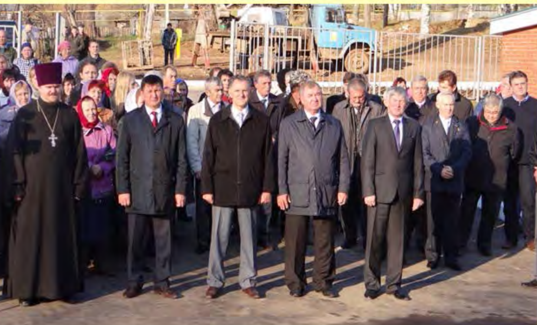
Рабочие визиты Президента Удмуртской Республики Волкова А.А. 2006, 2011, 2012г.г.