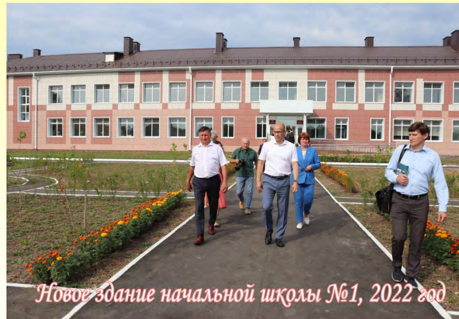
Новое здание начальной школы №1, 2022 год