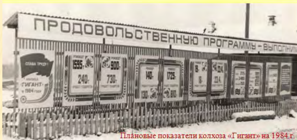
Плановые показатели колхоза «Гигант» на 1984 г.