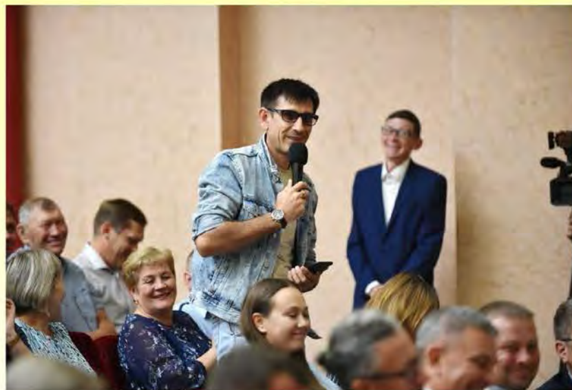
Встреча с населением Кизнерского района Главы Удмуртской Республики А.В. Бречалова 2022 г.