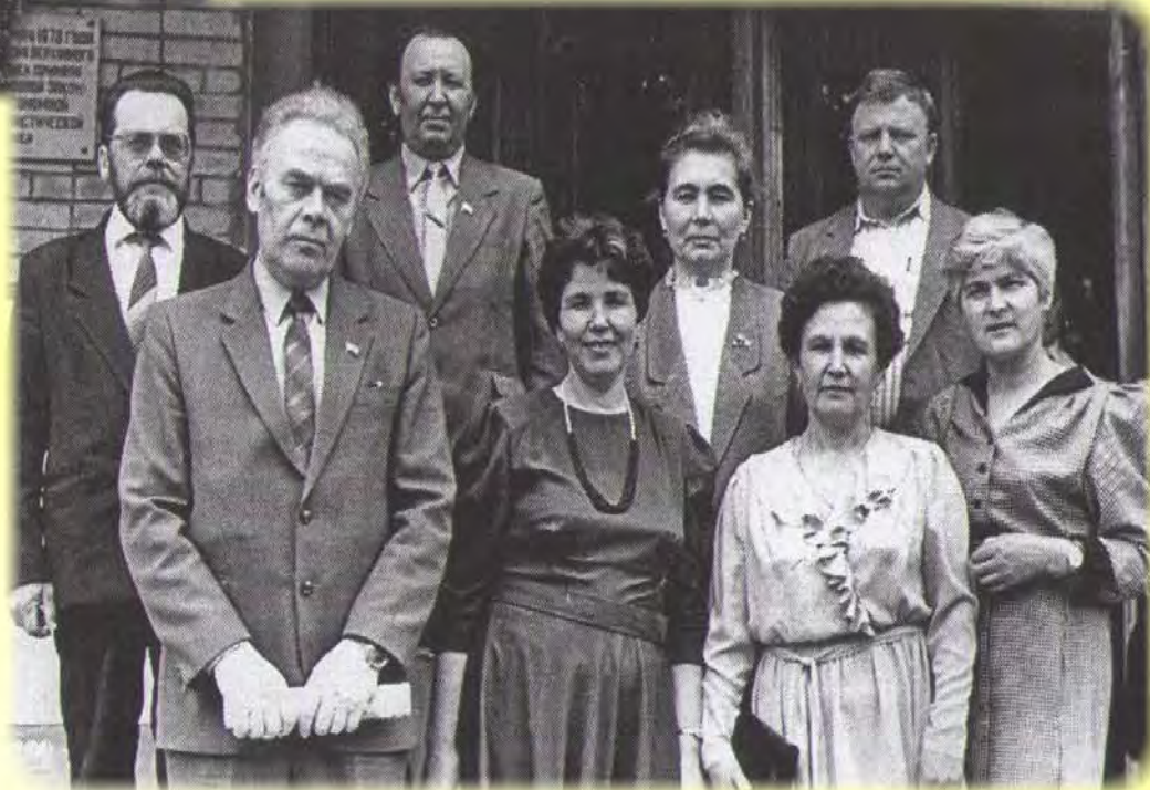
Делегация Кизнерского района на втором съезде Финно-угорских народов, 1992 год