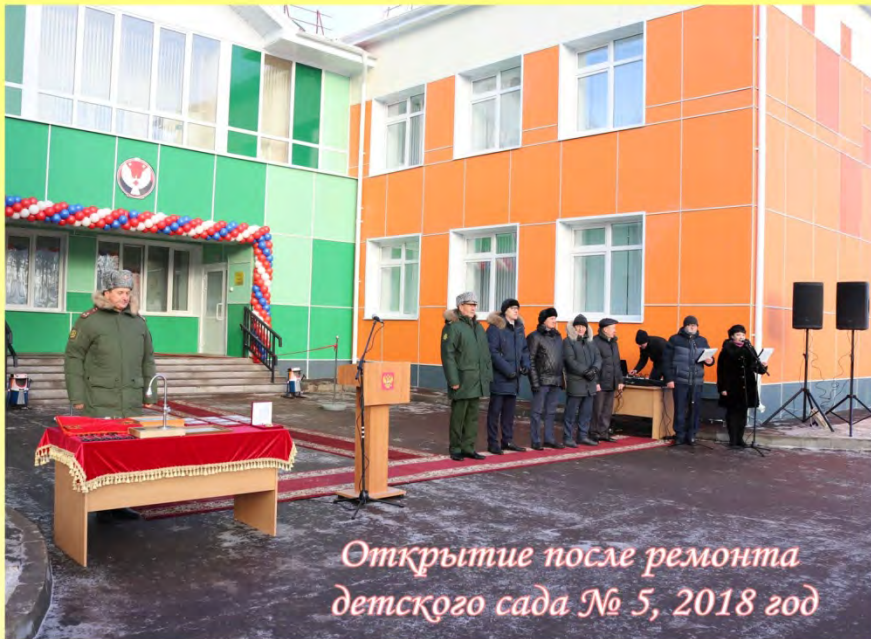
Открытие после ремонта детского сада № 5, 2018 год