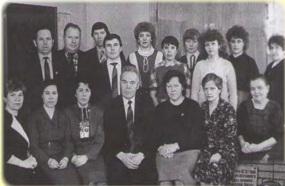
Коллектив Кизнерского райисполкома, 1989 год