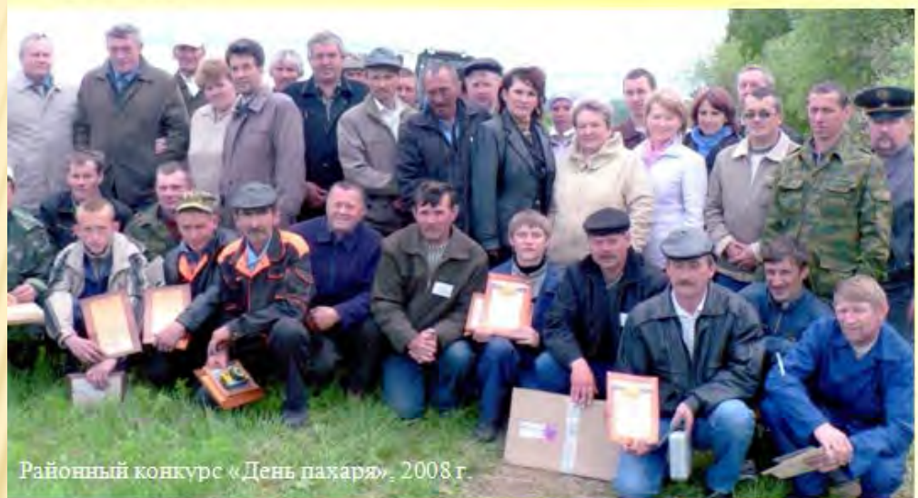
Районный конкурс «День пахаря», 2008 г.