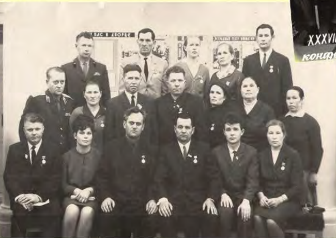
Делегация Кизнерского района на областных партийных конференциях, г. Ижевск