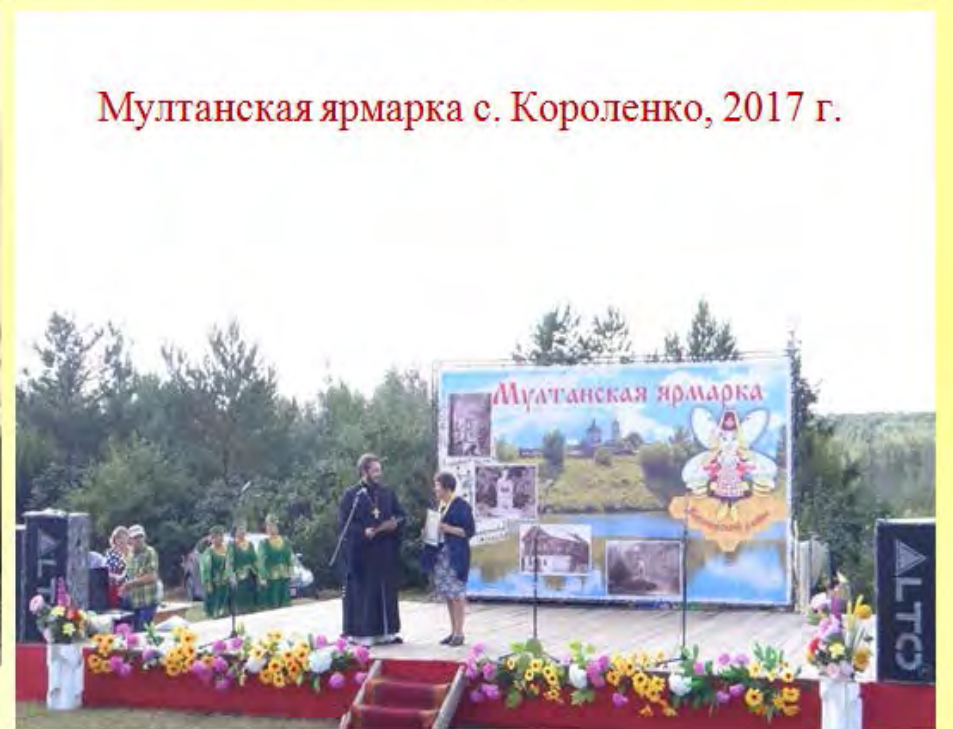
Мултанская ярмарка с. Короленко, 2017 г.