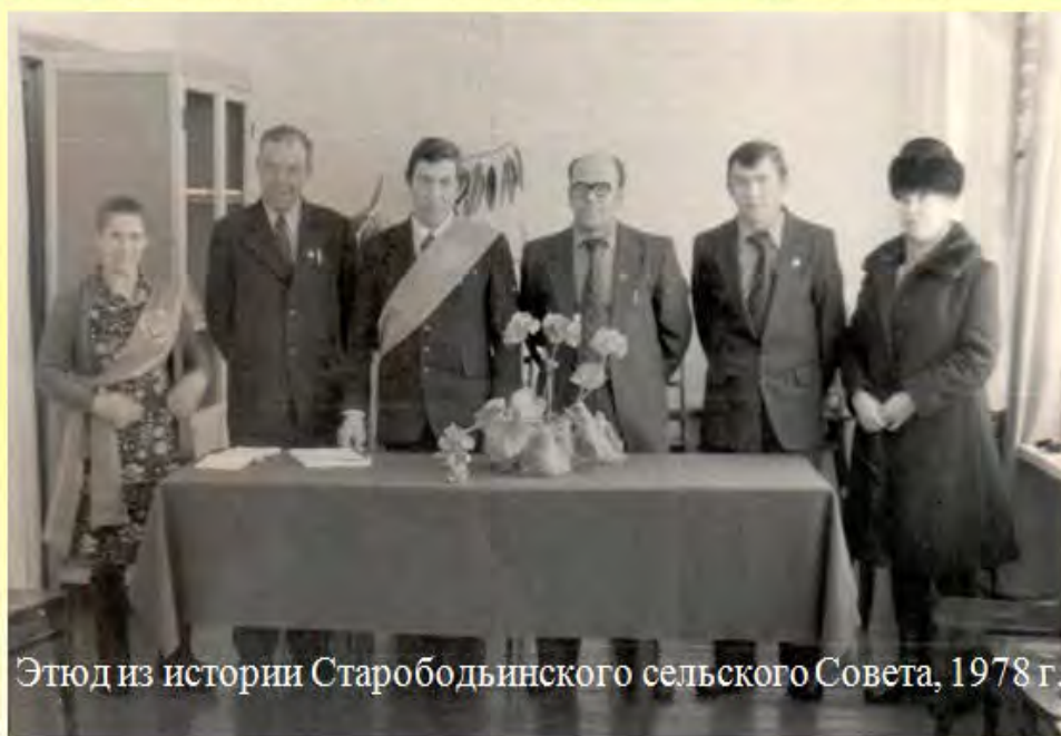
Этюд из истории Старободьинского сельского Совета, 1978 г.