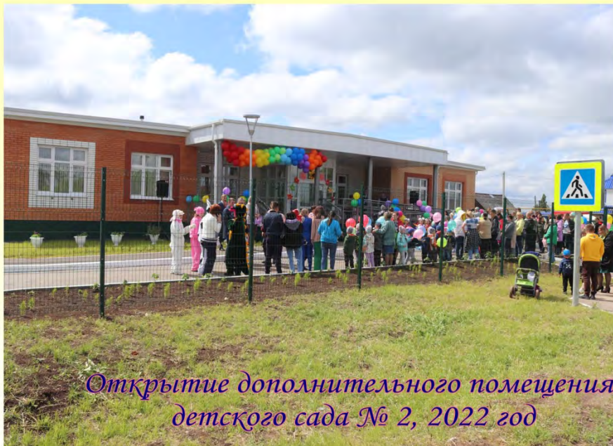
Открытие дополнительного помещения детского сада № 2, 2022 год